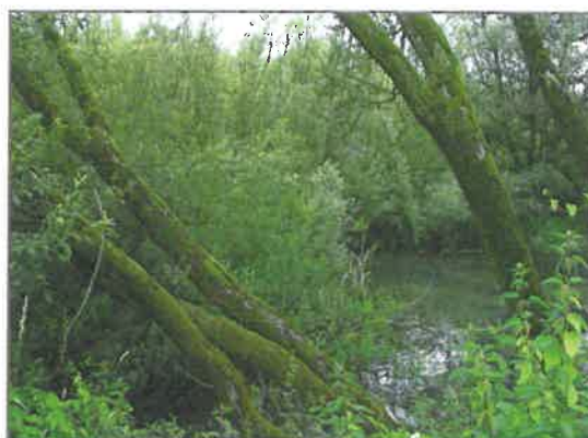
► Een voorbeeld van begroeiing op een voedselrijke en natte bodem: wilg, op de voorgrond grote brandnetel.