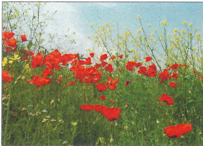
► Klaproos, een pionierssoort bij de kruiden.

In zeer dynamische milieus (kust, zoute wind, sterke stroming, golfslag, intensief betreden of roeren van de grond) blijft de successie vaak steken in pioniers- of overgangsbegroeiingen.