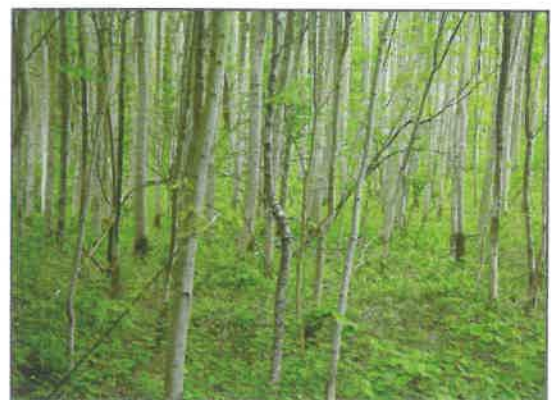
► Een essenbos in de stakenfase.