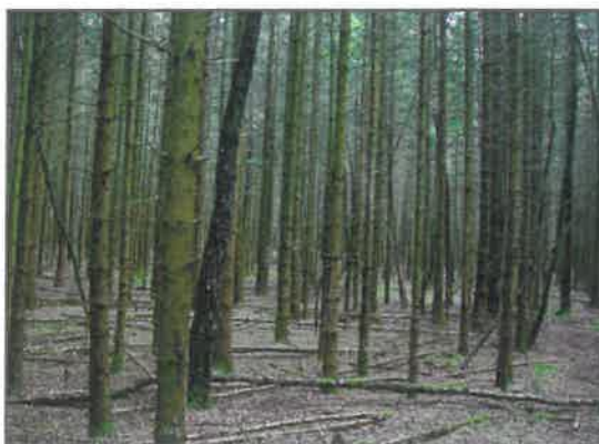
► Een fijnsparrenbos in de stakenfase.

Het kronendak is in deze fase dicht gesloten en de bomen groeien sterk de hoogte in. Vaak is de concurrentie tussen de bomen onderling erg groot, waardoor veel bomen afsterven. Er vindt zo een natuurlijke dunning plaats. Het proces van de natuurlijke taksterfte en takafstoting is zover gevorderd dat de beplanting doorzichtig is geworden. De ondergroei is beperkt tot schaduwverdragende soorten. Onder bomen die veel licht doorlaten zal meer kruidengroei voorkomen (zoals te zien is op de rechter foto hieronder).