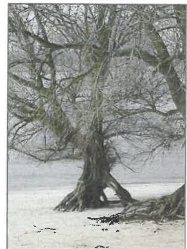
► Schietwilg, een pionierssoort bij de bomen, op een extreme groeiplaats langs de Waal bij Nijmegen.