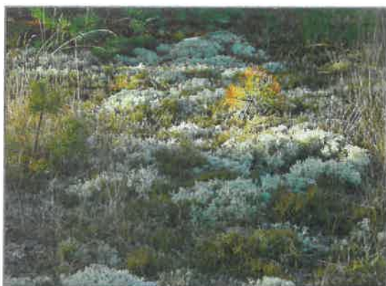
► Een voorbeeld van begroeiing op een zeer voedselarme bodem: rendiermos en grove den.

Deze gronden zijn verrijkt (geweest) door bijvoorbeeld bemesting. Gronden kunnen ook zeer voedselrijk zijn geworden door beheer uit het verleden, bijvoorbeeld een jarenlang maaibeheer waarbij het gras blijft liggen en ter plaatse verteert.